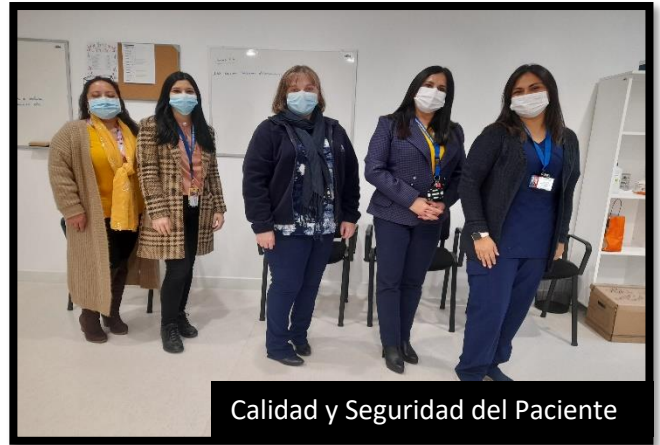
Calidad y Seguridad del Paciente