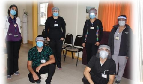
Kinesiología y Rehabilitación