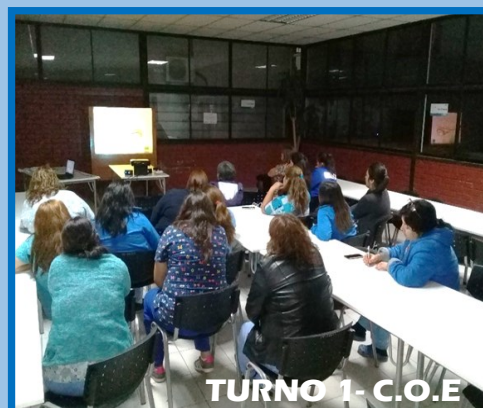
TURNO 1- C.O.E