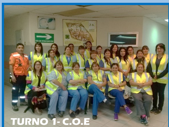
TURNO 1- C.O.E

Invitamos a seguir construyendo nuestro Hospital Seguro, la cual finalmente es tarea de todos.