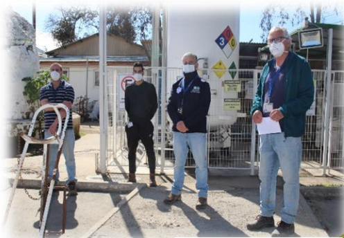
Central de Gases

Agradecemos el trabajo de cada uno de nuestros equipos