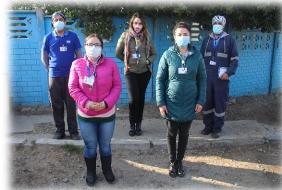
Higiene y Seguridad